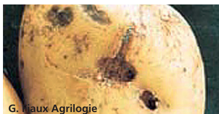
G. Fiaux Agrilogie