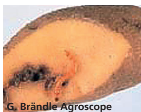
G. Brändle Agroscope