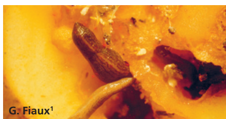
G. Fiaux 1